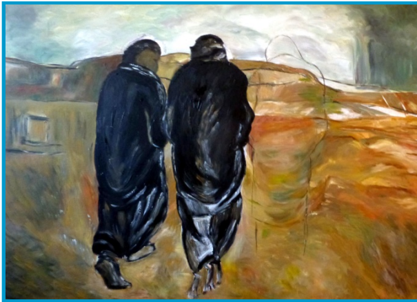
Annette Booke: Weg nach Emmaus